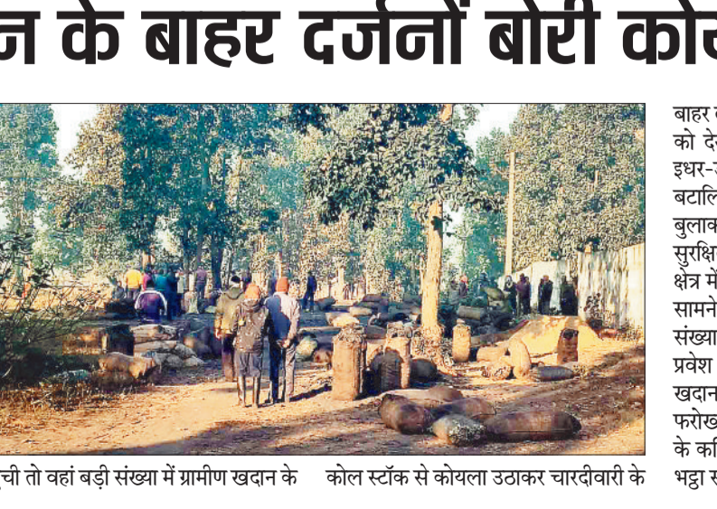
पहुंची तो वहां बड़ी संख्या में ग्रामीण खदान के कोल स्टॉक से कोयला उठाकर चारदीवारी के