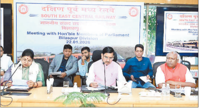
बैठक में उपस्थित सांसद।

तथा बैठक के औचित्य पर सवाल उठाया। दक्षिण-पूर्व-मध्य रेलवे से जुड़े संसदीय क्षेत्र के सांसदों की बैठक गुरुवार को रेल महाप्रबंधक कार्यालय में हुई। केन्द्रीय राज्यमंत्री एवं बिलासपुर सांसद तोखन साहू की अध्यक्षता में हुई बैठक में सरगुजा सांसद चिंतामणि महाराज ने प्रस्तावित नई रेल लाइनों से लेकर रेलवे के विभिन्न स्टेशनों में यात्री सुविधाओं के विस्तार सहित अन्य मुद्दों को प्रमुखता से उठाया। सांसद ने महाप्रबंधक से बैठक के एजेंडा के बारे में पूछा। महाप्रबंधक ने पूर्व में इसकी जानकारी उपलब्ध कराने की बात कही। सांसद ने पूर्व में हुई बैठक में उठाए गए मुद्दों के क्रियान्वयन के बारे में पूछा तो उन्होंने रेल मंत्रालय को प्रस्ताव भेजने की जानकारी दी। पिछली बैठक में सांसद ने सच्ची उत्पादक किसानों की सुविधा के लिए कमलपुर में ट्रेनों का उद्धार निर्धारित करने की मांग की थी जिसे महाप्रबंधक ने वाणिज्यिक दृष्टि से व्यवहार्य नहीं बताया। चिंतामणि महाराज